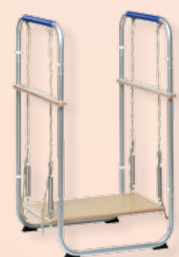
pedalo®-Stabilisator „Therapie“ Art.-Nr.: 653086-01

Bei der Ausführung „Therapie“ kann sich der Übende an den hüfthohen Bügeln beidseitig Festhalten. Der Bewegungsaus Schlag ist langsamer und weicher. Mit Hilfe der Bewegungsbegrenzer kann der Bewegungsraum und die Schwingungsgeschwindigkeit eingestellt werden. In der Therapie zeigt der pedalo®-Stabilisator