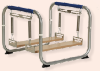
pedalo®-Stabilisator „Profi“ Art.-Nr.: 14003000

Der pedalo®-Stabilisator „Profi“ beinhaltet die Ausführung „Sport“. Sein funktioneller Einsatz ist um zwei zusätzliche, voneinander getrennt abgehängte Fußbretter erweitert. Die Beine arbeiten hier unabhängig voneinander. Einseitig muskuläre und koordinative Schwächen werden somit dem Übenden/Therapeuten noch besser aufgezeigt. Die Fußbretter bieten mehr Mobilität nach allen Seiten und erfordern mehr Stabilität, vor allem in der Fuß- und Unterschenkelmuskulatur. Die zusätzliche, schnell aufgesteckte Standfläche (wie „Sport“) verbindet beide Fußbretter miteinander. Die Einhängung der Standfläche kann oben und unten 10-fach horizontal verstellt werden. Entsprechend verändert sich das Schwung- und Kippverhalten von leicht bis schwierig.