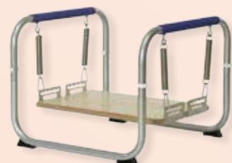
pedalo®-Stabilisator „Sport“ Art.-Nr.: 653085-01

„Therapie“ seine volle Wirkung im Einsatz von Patienten mit neurologischen Ausfällen. Bei Senioren wird er bevorzugt zum Training des Gleichgewichtes, der Standsicherheit und zur Sturzprophylaxe eingesetzt.