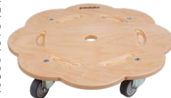
In Kombination mit original Stapelsteine

Rollbrett Set: 4 Rollflitzer, 1 Stapelvorrichtung. 6,81kg. 25020000