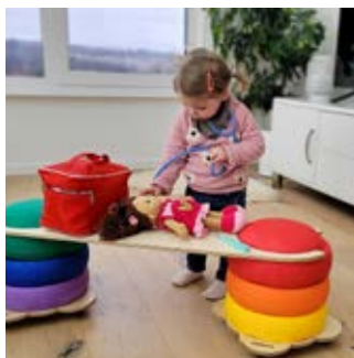
In Kombination mit Balanciersteg Extrabreit