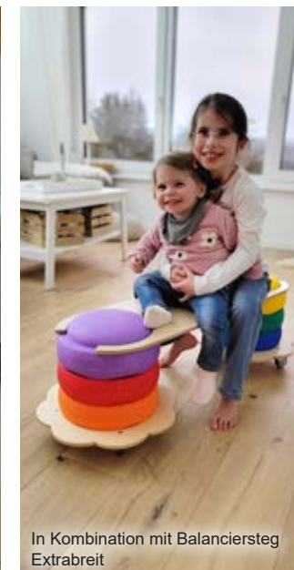
In Kombination mit Balanciersteg Extrabreit